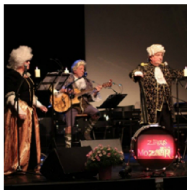
Zirkus Mozaar entertainment