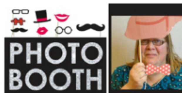
Photobooth met Daria fotografie

Prijs: 32 Euro p.p. Overschrijven op rekening Afasie Vlaams-Brabant BE24 6528 3934 6338 Betalen tegen 23 september 2018 Overschrijving geldt als inschrijving.